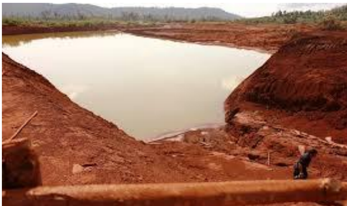
Gambar 1. Lokasi penelitian.

Penelitian ini menggunakan Rancangan Acak Kelompok (RAK) Faktorial dengan 9 kombinasi perlakuan yang diulang 3 kali dan 5 tanaman contoh sebagai tanaman indicator adalah selada merah keriting. Adapun perlakuannya adalah 1) jenis rakit (R) dengan 3 taraf yaitu R_1 = rakit limbah gelas plastik ukuran 250 ml, R_2 = rakit limbah botol plastik ukuran 600 ml dan R_3 = rakit limbah botol plastik ukuran 1500 ml dan 2) jenis kompos (K) dengan 3 taraf yaitu K_1 = kompos rumput purun, K_2 = kompos rumput bakung dan K_3 = kompos rumput Gegas (Gambar 2 dan 3).