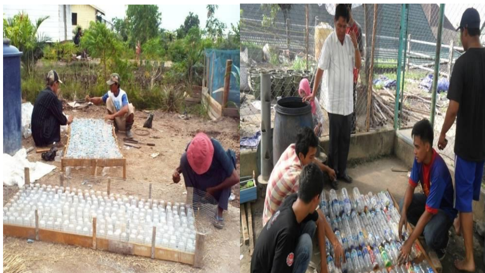
Gambar 4. Pembuatan rakit dari limbah plastik air mineral.

Setelah petakan rakit selesai dibuat kemudian, karung plastik kita letakkan pada bagian alas/bawah gelas plastik, setelah itu baru kita berikan media tanam.