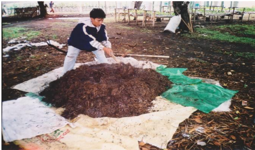
Gambar 3. Pembuatan kompos dari berbagai jenis rumput.

Pembuatan air mineral yang telah dikumpulkan kemudian di rangkai dengan menggunakan kawat pada petakan rakit yang terbuat dari kayu hek dengan ukuran lebar 2 m dan panjang 3m (Gambar 4).