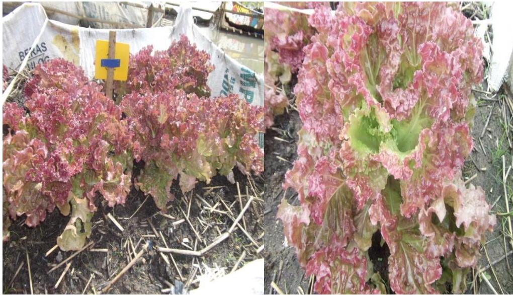
Gambar 7. Kondisi tanaman siap panen.

daun pertanaman (helai), berat berangkasan basah (g), dan produksi per rakit (kg) (Gambar 7).