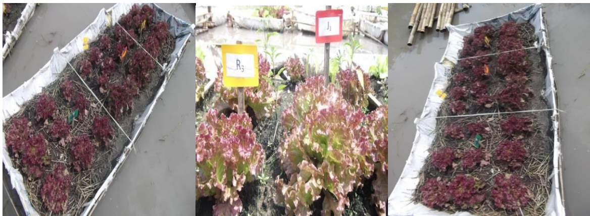
Gambar 6. Kondisi tanaman selada merah keriting di atas rakit.

dengan cara menyemprot tanaman secara rutin seminggu sekali dengan dosis 1 liter bahan pestisida organik dilarutkan dalam 10 liter air, diberikan 1 minggu setelah tanam sampai menjelang panen (Gambar 6).