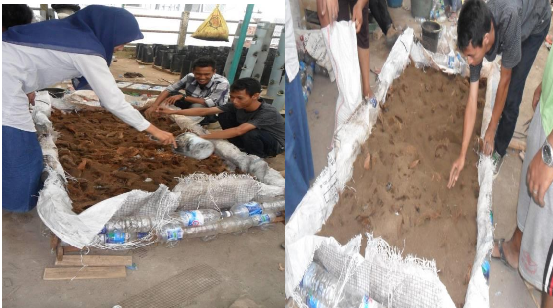
Gambar 5. Pembuatan kompos dari rumput dan pemberian media tanam pada rakit.

Sebagai pupuk susulan diberikan pupuk organik cair racikan sendiri yang terdiri dari beberapa jenis tanaman yang direndam dalam air selama 2 minggu. Pemberian pupuk cair organik dengan dosis 1 liter bahan pupuk dilarutkan dalam 10 liter air dengan selang waktu 1 minggu sekali setelah tanam.